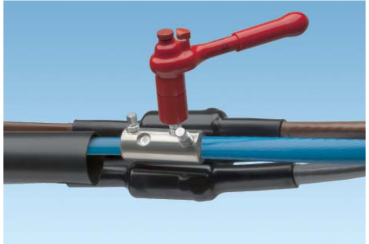
LJSM-xxxx-PP-Muffen – geeignet für die Installationen der Verbinder in Parkposition auf den Leitern

In den TE Connectivity-Raychem Laboratorien in Ottobrunn wurden alle anderen Größen ebenfalls vollständig typgeprüft.